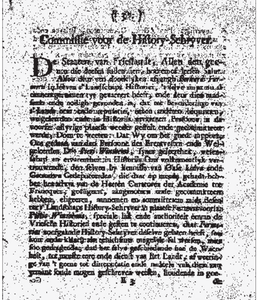
De commissie voor 's Lands-historieschrijver Pier Winsemius, uit 1616: 'Tot bevordering van 's Lands eere ende reputatie (...) tot meeste eere ende dienst van het Landt' (uit: E.M. van Burmania, Analecta..., Leeuwarden 1750)

ninga. Hij gaf ons een helder beeld van een tot op heden vrijwel onbeschreven periode: 1620-1640 onder de titel 'Geld en vrijheid'. In deze tijd was sprake een uitkristalliseren van het politieke stelsel zoals dit tot 1795 standhield en daarmee was eigenlijk de inhoudelijke afronding van het congres gegeven. Spanninga schetste de oplopende schuld van Friesland - van anderhalve ton in 1620 naar 6,5 miljoen in 1635 - aan de Generaliteit. Tussen beide data lagen minstens tien vruchteloze bezendingen vanuit Den Haag om Friesland tot betaling te bewegen. 'Haagse heren', onder wie met uiteenlopende excuses ('rude people' e.a.) graag onder dergelijke missies uit trachten te komen. Binnen het gewest kon een reglementair gekortwiekte stadhouder weinig uitrichten tegen onstabiele plattelandskwartieren en weigerachtige steden. Steden ook, die recalcitranter werden na de invoering van een nieuw - voor hen ongunstiger - belastingstelsel (sinds 1637 bekend als de zogeheten Vijf Speciën). Toen een combinatie van ontvreden edelen en burgers enkele steden (Harlingen en Sneek voorop) de vrije hand gaven in hun magistraatsbestelling was de maat vol en